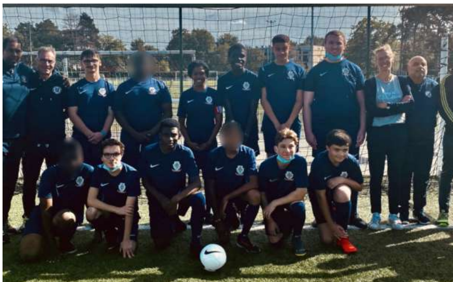
IME L'ESPOIR – L'ISLE ADAM – 28 SEPTEMBRE 2021

Retrouvez ci-dessous les premières photos et vidéos de l'IME Val d'Oise Tour :